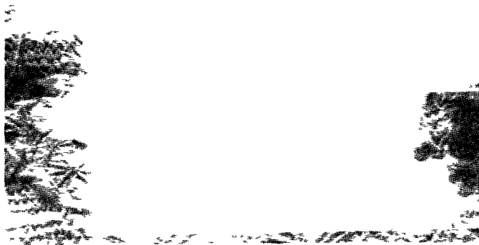
Toma de Lakisch por Senaquerib: la deportación a Nínive.

Ya está Ezequiel dispuesto para su misión: tiene que ir a anunciar a su pueblo rebelde el juicio del Señor y sus palabras. Es una misión dura, pero no está solo. El es solamente un enviado.